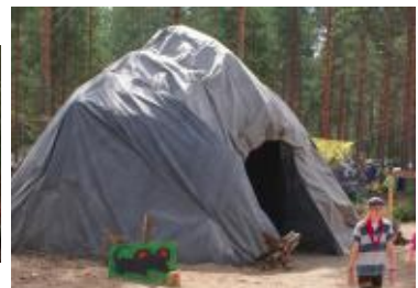
teksti: Veera